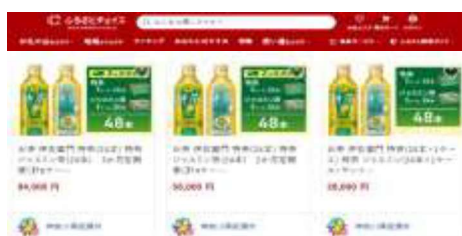
(ふるさとチョイス)

市役所地下1階にてふるさと納税返礼品の取扱い、また、切手の販売、職員の福利厚生に関する業務を行い、収益金を福祉事業に活用し自主財源の確保を行います。