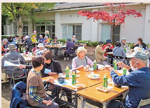
令和4年度開催の様子

新型コロナによる影響で色々な制限がある中、昨年度は安全対策を取りながら各活動を行いました。特に3年ぶりに開催しました「ふれあい懇親会」は室内から寺尾公園内に場所を移して実施し、とても好評でした。また、地区社協が区内であまり認知されていない現状を考え、各組長会などに参加させて頂いてのPR活動を実施致しました。さらに、あんしん袋などの個別支援活動も、地区社協だけでなく自治会を中心とした地域の各団体と、協働できる仕組みづくりを考えていきます。