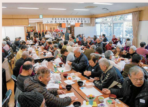
コロナ前開催の様子

寺尾天台地区社協では、令和2年1月に新型コロナウイルスへの感染が国内で確認されて以降、定期総会は書面での開催、ふれあいの集いをはじめとする各事業は中止にして来ました。5月8日より、新型コロナウイルス感染症が5類感染症に変更されたことで、ふれあいの集いやサロン活動の各事業の再開をすべく準備を進めています。しかしながら新型コロナウイルスが完全収束していないため、感染症対策を意識した中で活動の再開となりますが「笑顔で再会できる場づくり」を目指し、役員一同取り組んでいきたいと思っています。