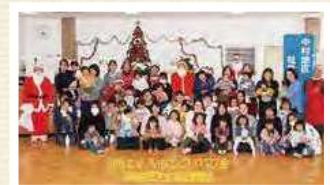
幸齢者昼食会(寺尾綾北地区)