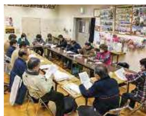
ささえあい井戸端会議