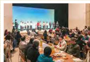
ボランティア連絡協議会交流会①