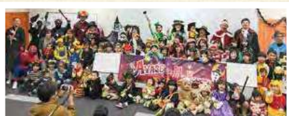
あやせTomorrowプロジェクト