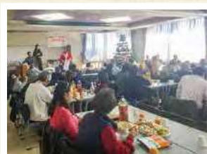
ボランティア連絡協議会交流会②