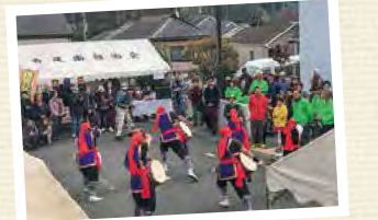
地区社協まつり(寺尾南地区)