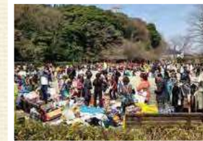
地区社協まつり(上土棚地区)