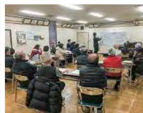
地域福祉活動計画