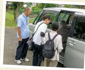
あやせ送迎サービス