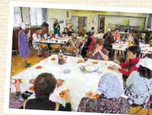
キムチづくり(小園地区)