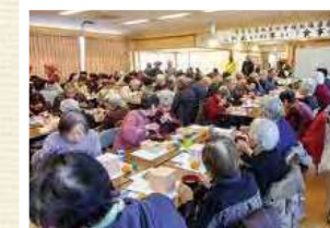
ふれあいの集い昼食会(寺尾天台地区)