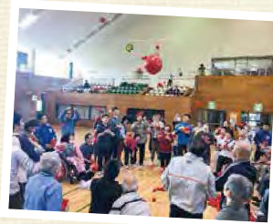
福祉レクリエーション大会