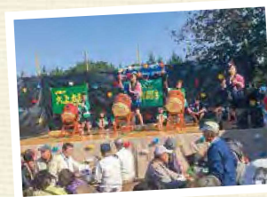
笑いとおしゃべりいっぱい市(大上地区)