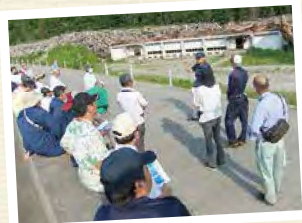
災害ボランティア活動(釜石市)②