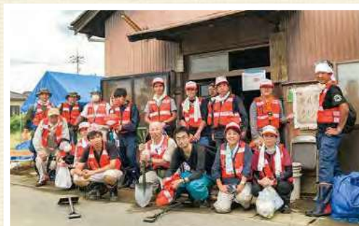
災害ボランティア活動(倉敷市)②