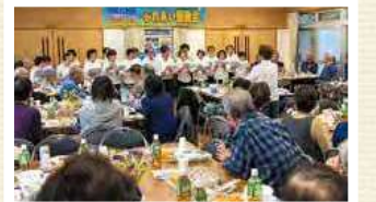
ふれあい懇親会(寺尾北地区)