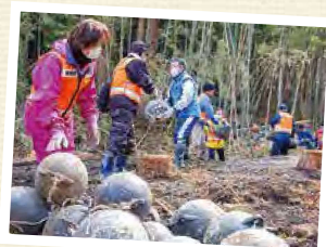
災害ボランティア活動(釜石市)③