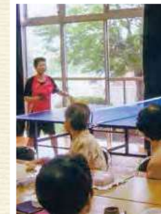
ピンポン健康サロン(吉岡地区)