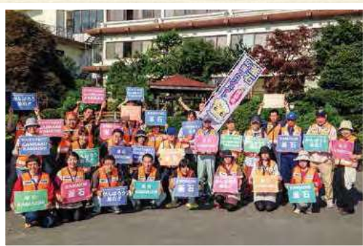
災害ボランティア活動(釜石市)①