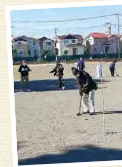
グラウンドゴルフ大会(早川地区)