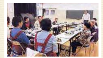
味噌づくり(蓼川地区)