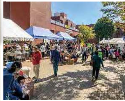
あやせ福祉ふれあいまつり