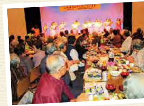
敬老会(上深谷地区)