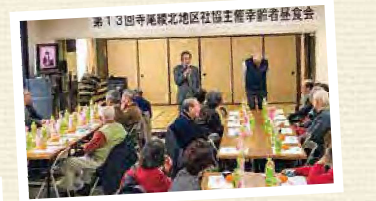
第13回寺尾線北地区福祉主催季節者昼食会