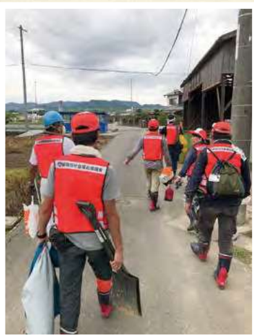
災害ボランティア活動(倉敷市)①