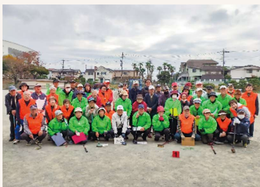
(記念撮影時のみマスクを外しています)