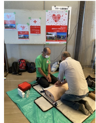
綾瀬市赤十字奉仕団