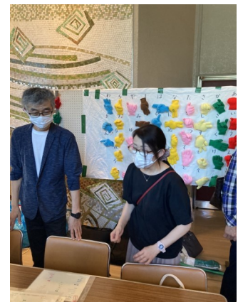
綾瀬市手話サークルあやの会