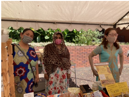
ウィメンズ ジャパニーズクラス

日時：令和4年10月2日（日） 場所：綾瀬市オーエンス文化会館 規模を縮小しながらも、2年ぶりに開催したふれあいまつりには、パネル展示で5団体、出店で7団体の登録団体ボランティアの皆さまが参加されました。