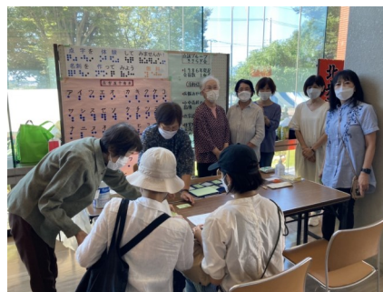
点訳グループきさらぎ会