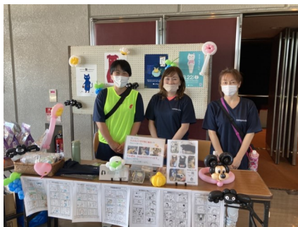
Compassion -しっぽのついた仲間たち