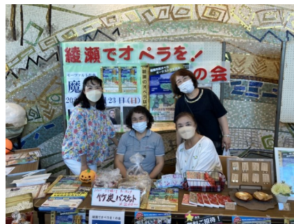
綾瀬でオペラを！の会