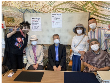
綾瀬マジックサークル