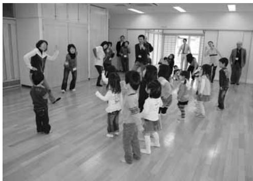
「皆でいっしょに体操」