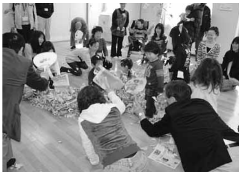
「新聞紙遊びに熱中する子供たち」

寺尾南地区社協では初めての子育てサロンの開催です。お子さんに喜んで頂けるサロンにするため、皆様のご意見をおまちします。