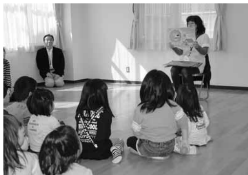
「紙芝居を楽しんで頂きました」

紙芝居、新聞紙遊びや体操で楽しい一時を過ごして頂きました。また、子育ての楽しみや悩みで同じ環境にある、お母さん方が意見交換出来る子育てサロンになればと期待しております。最後にお母さん方と意見交換をさせて頂きました。今後の子育てサロンの参考とさせて頂きます。