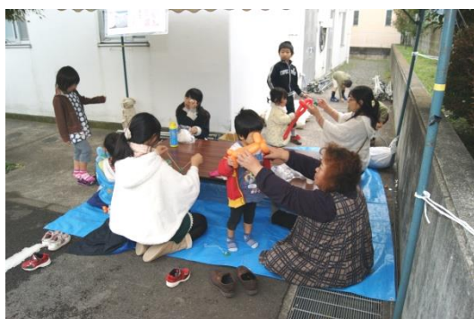
(子供広場で風船アートを楽しむ)