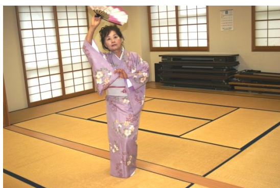
(日本舞踊披露する愛好者)