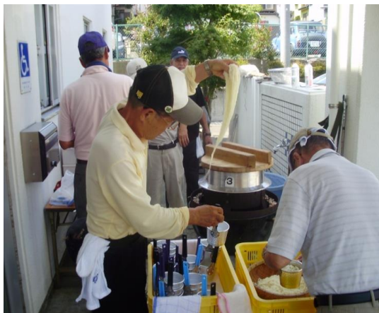
冷しソーメンをつくるスタッフ

I 第3回ふれあいサロンを8月31、寺尾南自治会館で開催。参加者47名高齢者（75才以上）主体として開催、季節がら冷しソーメンでの食事会また、生活習慣予防について、講演を実施しました。