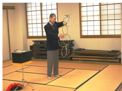
(マジックを披露する愛好者)