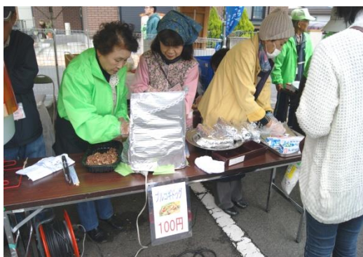
(プルコギドックを今回も販売)

11月10日（日）寺尾南自治会館に於いて、第2回福祉まつり開催 120名が参加、盛大に実施されました。 特記事項・・・家庭菜園愛好者の方から、さつま芋のご寄付を頂き、焼き芋販売、更に今回は、甘酒を参加者に無料でふるまう。