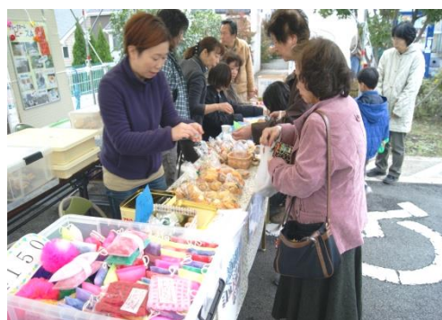
(自家製品を売る施設のスタッフ)