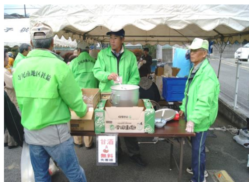
(甘酒をふるまうスタッフ)