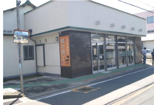
東柏ヶ谷のパッピーサロン 銀の椅子を視察