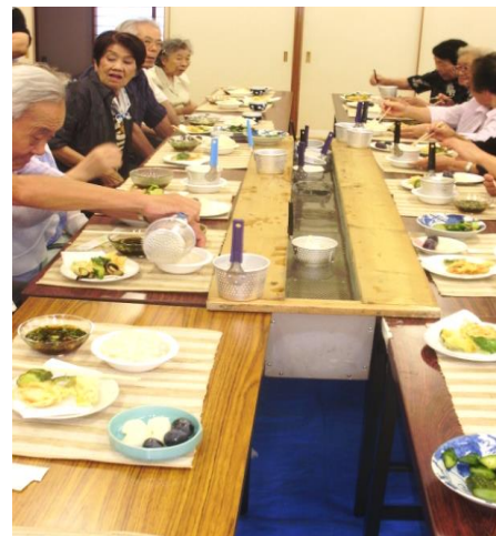
冷しソーメンの食事会