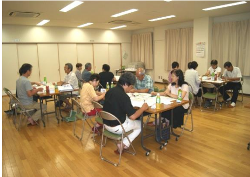
ブレインストーミングによる 問題事項の抽出（ボランティア部会）

26年2月サロンなごみ開設に向け、ボランティア部会では、準備作業を推進中です。また、並行して、自治会館等を利用した、サロンなごみの開催（試行）検討、更に他地域の常設サロンの視察を実施しております。常設サロンなごみ開設の必要性をご理解頂くとともにご支援、ご協力の程、お願いいたします。