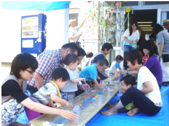
お母さん方と水遊びを楽しむ子供達

第8回子供サロンを7月2日、寺尾南自治会館で開催。参加者は、小学校入学前の子供さんを主体に参加呼びかけ、14家族17名が参加された。水遊びを楽しんで頂きました・・ちよこっと遊び「何が流れてくるかな」また、イベント等について、お母さん方と意見交換を行いました。