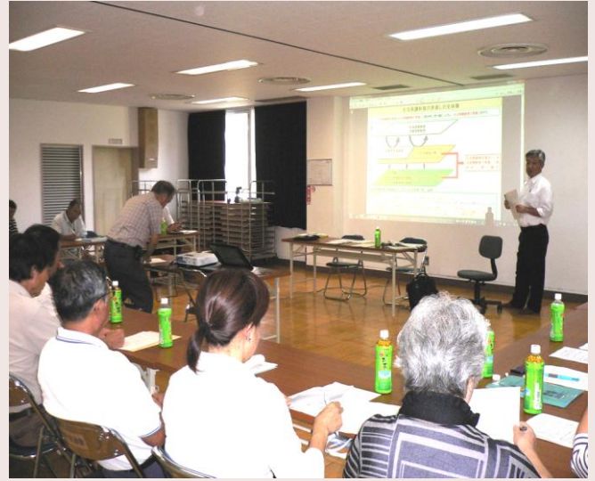
中村自治会館にて

・世帯収入の扱いや色々な救済もあるので、市の窓口「福祉総務課」に遠慮なく相談下さいとのことでした。地区社協メンバーの「民生委員」や「地域包括支援センター 泉正園」に相談されるのもよいと思います。(記 馬場)