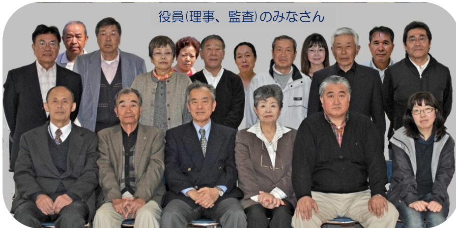
役員(理事、監査)のみなさん