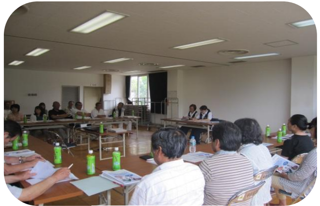
中村自治会館にて