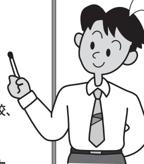
詳細リーフレットは、市社協窓口にあります。

住み慣れた自宅に住み続けたい高齢者世帯に対して、土地・建物を担保とした生活資金の貸付けをします。