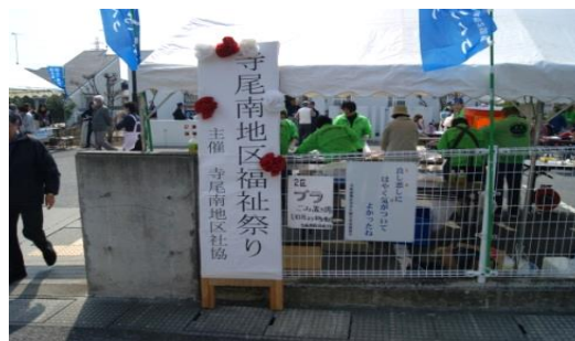
昨年実施した模擬店及び福祉まつり会場(寺尾南自治会館)