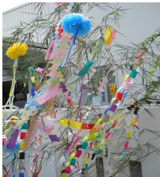
おもいおもいの願いを短冊に託す