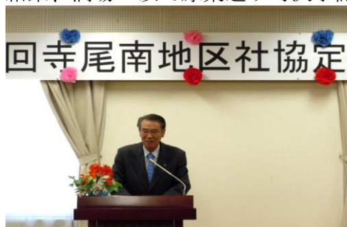
笠間市長のご挨拶