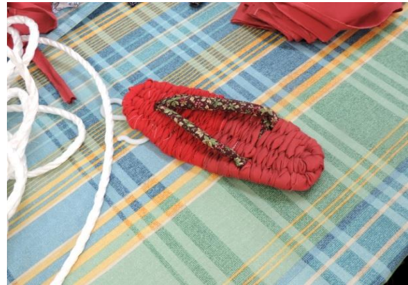
参加者が作った作品