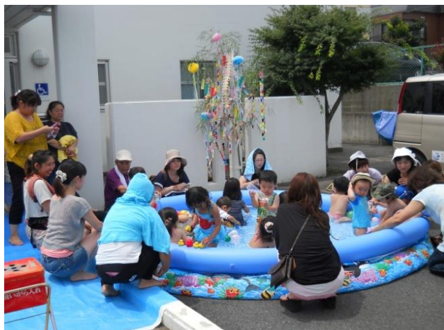
プールで遊ぶ子供さんとご家族