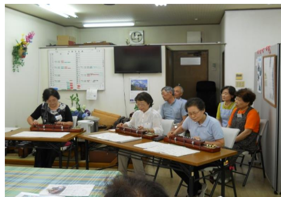
「 地域の方々による大正琴の演奏で楽しい一時を過ごして頂きました 」