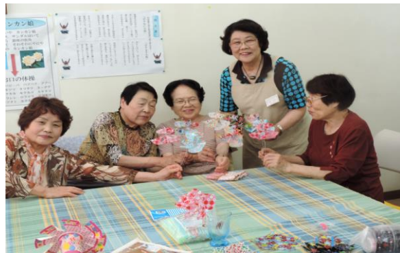
出来あがった風車見せ合う参加者