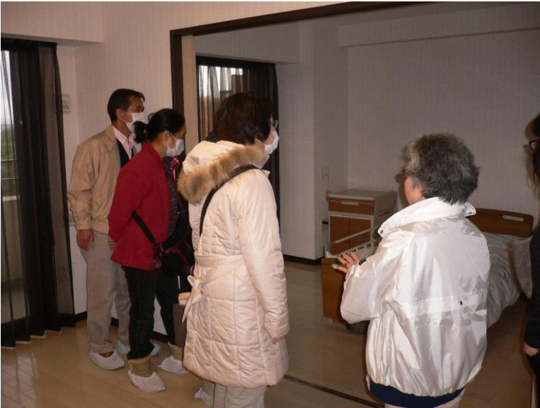
介護付有料老人ホーム