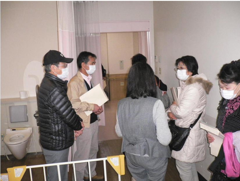
特別養護老人ホーム