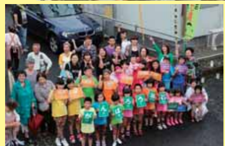
【写真】第1回 釜石・綾瀬夏の交流祭りの様子

※今回は、がれきの撤去等のボランティア活動はございません。 ※第1期はタウンニュース、ホームページにて募集を行っています。