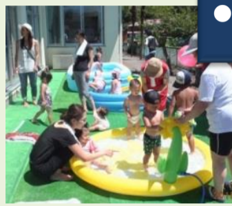
楽しいな！「七夕」「プール」に「クリスマス」