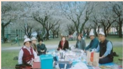
サロン「きずな」のお花見です。毎月、様々な活動をしています。