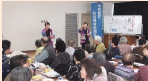
楽しい演芸と食事は、お年寄り達の毎年恒例の楽しみです。