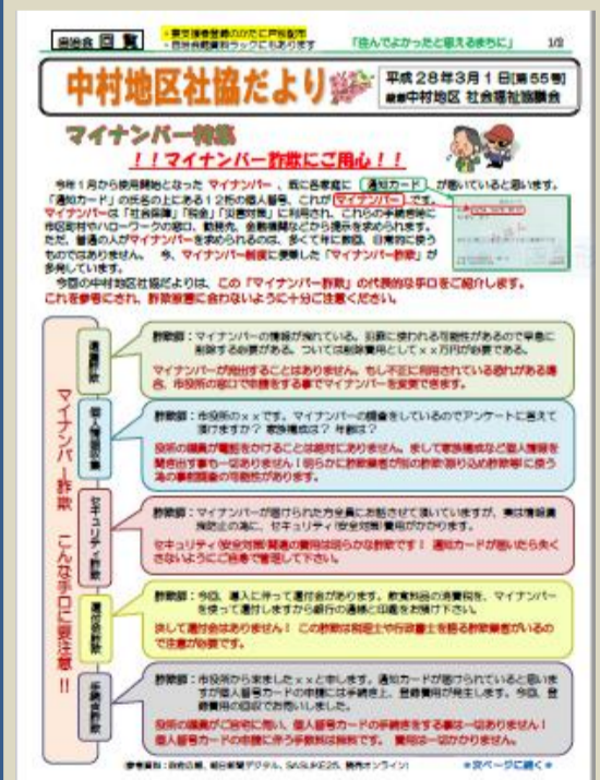
2015年度の第3号 (年3回、発行しています。)