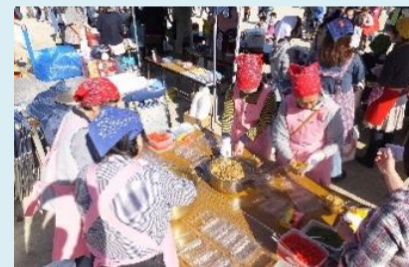
「くすのきまつり」では、みんなで楽しく焼きそばを作りました。