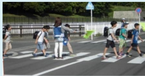
1区では浅間橋付近でも見守りをスタート