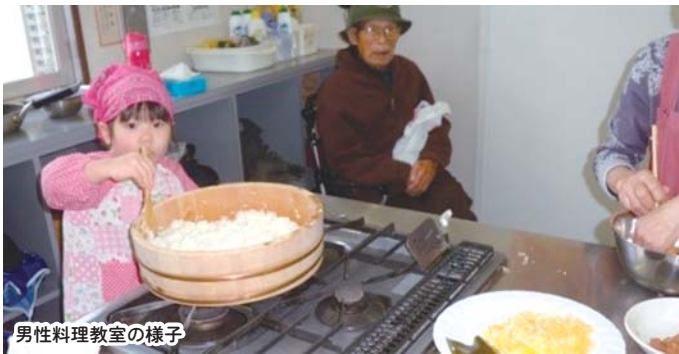
男性料理教室の様子