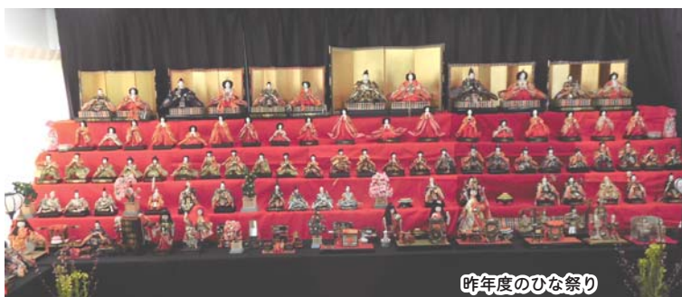
昨年度のひな祭り

最近行ったイベントは、1月開催のつるし雛展。続く3月開催のひな祭りは中止になりましたが、優雅に並ぶお雛さまたちを来春には見ていただきたいと、思いも新たに活動しています。