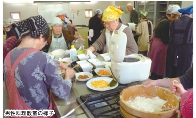
男性料理教室の様子

今回は、高齢者を対象とした「料理教室」を紹介します。盛盛会（もりもりかい）会員の理事さん指導で生活習慣病予防に適した献立（ツナ寿司、かぼちゃのマセドアンサラダ、餃子スープ）を20名の参加で行いました。男性の方にも多く体験していただけるよう呼びかけましたが、4名の参加がありました。料理終了後の試食では皆さんからの感想等を聞く時間はありませんでしたが、料理の味には皆さん納得されていました。次回は男性の方もぜひご参加ください。