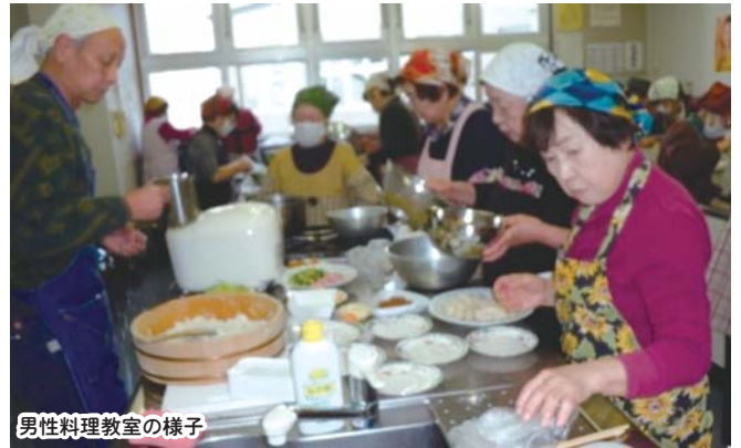
男性料理教室の様子