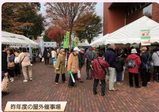
昨年度の屋外催事場