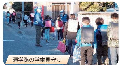
通学路の学童見守り

働いて収入を得たいと考えている方はシルバー人材等で個人の技能・技術を活かす事も選択肢の一つです。