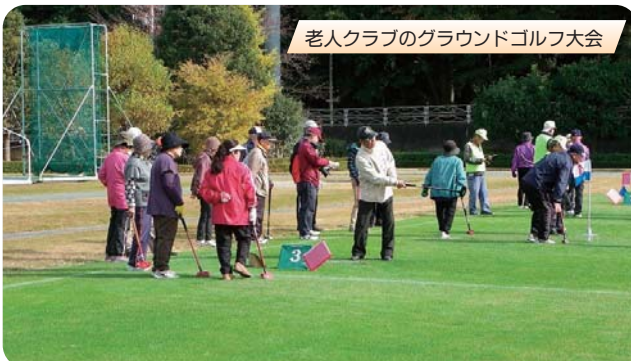
老人クラブのグラウンドゴルフ大会

一つは老人クラブへの参加です。幸い中村地区には3つの老人クラブがあり、合わせて227名の方々が加入され様々なイベントに参加されていますが、もっと加入者を増やしたいと考えています。