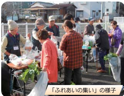
「ふれあいの集い」の様子

例年に比べ、子どもの参加が少なかったように思いますが、地元の交流の場として、今後も活動していきます。