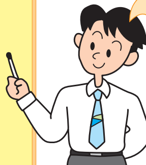
詳しくは本会ホームページをご覧ください。

住み慣れた自宅に住み続けたい低所得の高齢者世帯に対して、土地・建物を担保とした生活資金の貸付です。