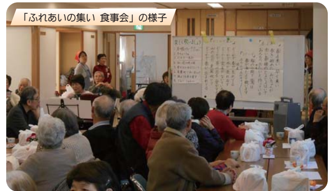
「ふれあいの集い 食事会」の様子

平成28年度の事業として、平成29年2月19日(日)に76歳以上の方をお招きして、自治会役員やOBの方のご協力を得ながら「ふれあいの集い 食事会」を開催しました。今回で3回目となりますが、1回目は75歳以上の方が対象でした。近年対象者の増加に伴い、会場の関係で2回目からは76歳以上の方を対象とさせていただいております。この傾向は、当分の間続くと予想されますので悩みです。