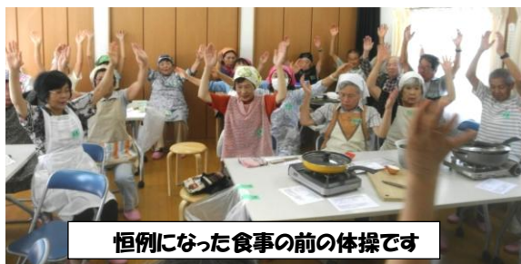
恒例になった食事の前の体操です