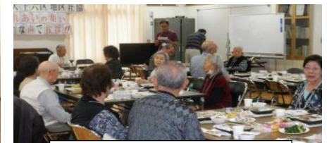
“6区ふれあいの集い”の様子