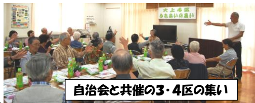
自治会と共催の3・4区の集い