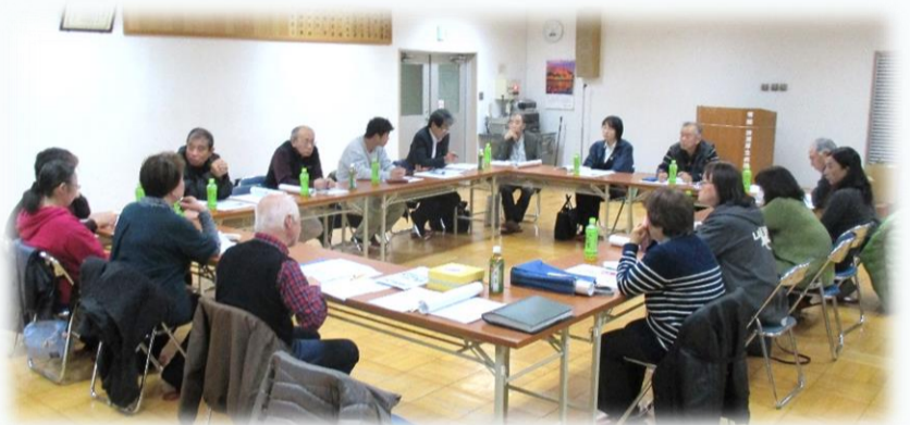
ささえあい井戸端会議-中村の様子