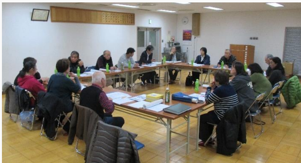
「ささえあい井戸端会議 中村」の様子

メンバーは多様な主体から構成されている中村地区社協理事のほか、市の地域包括担当、市社協、地域包括ケアセンター「泉正園」も参加します。