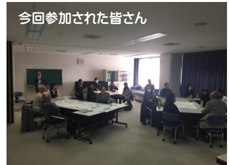
今回参加された皆さん