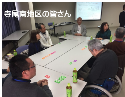
寺尾南地区の皆さん