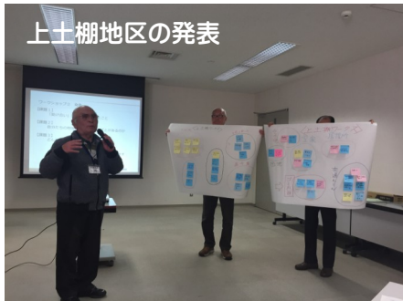
上土棚地区の発表