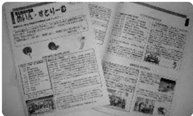
市社協窓口に置いてあります

ぜひ手に取ってみてください。 綾瀬市当事者団体交流紙 綾瀬市当事者団体連絡会の会報です。