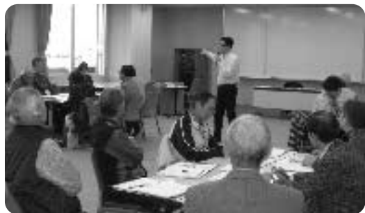
コミュニケーションは基本の基本です

この研修を通して、それぞれ地域福祉に関して考える機会となったかと思います。そしてその経験がこれからの地域での活動の糧になっていただければと思います。