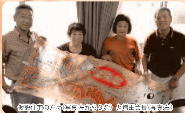
仮設住宅の方々(写真左から3名)と増田会長(写真右)

さて、東日本大震災の発生から、約1年10ヶ月が経過いたしました。被災地では一歩ずつ復興に向け、