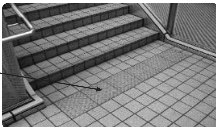
警告ブロック (点状ブロック)

また、視覚障がい者誘導用ブロックはJIS（2001年9月20日制定）規格で以下のように定められています。