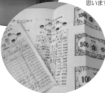
愛川町の先進的とりくみ地域通貨「幸」券