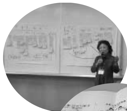
グループワークの成果を発表する受講生