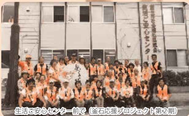
生活と安心センター前で(釜石応援プロジェクト第2期)

進んでおられると存じます。当会といたしましても、平成23年より被災地支援活動に取り組み、平成24年は岩手県釜石市へ延べ85名の市民の皆様と協働し、支援活動を実践してまいりました。私自身も支援活動に参加させていただき、被災された方のお話を伺い、地域福祉活動の必要性・重要性を再認識した活動でもありました。