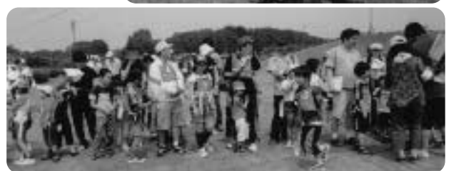
吉岡地区社協祭りの風景