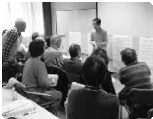
たすけあい「福祉マップ」を伝授

自分が住む地域を良くしていくため、お互いに支えあう温かい地域を作っていくために知っておきたい事柄などを学ぶ「あやせ地域支えあいサポーター研修」が、12月17日に終了しました。