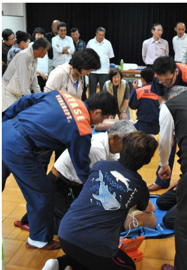
切迫感ある光景(2班に分かれ全員が実技)

◆日頃からAEDや防災について家族で話しましょう！市消防本部の方々のご協力ありがとうございました。(記：馬場)